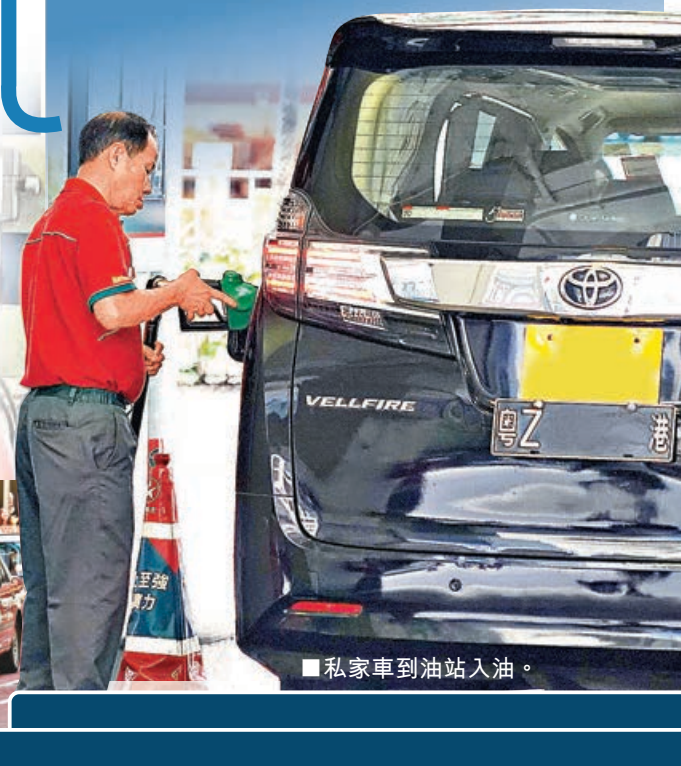
■私家車到油站入油。