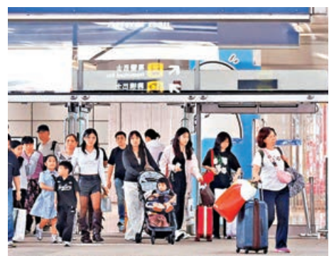
■大橋口岸每日有大量旅客出入境。