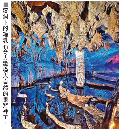
溶洞下的鐘乳石令人驚嘆大自然的鬼斧神工。

去如同開了冷氣一樣清涼，洞中有洞、有河、有橋、有瀑，一步一景，如同置身地下龍宮。旅客漫步其中，活像觸摸奇幻又神秘的時光痕跡，走到深處還能坐船穿越地下河，在鐘乳石五光十色燈光下泛舟河中，絕對是避暑之餘又適合打卡的最佳選擇。