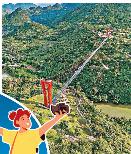
於粵北最大瀑布群頂端。

連州另一個必到之景點湟川三峽，是珠江流域北江水系的美麗峽谷，全長約20多公里，被稱為「廣東小三峽」。湟川三峽由仙女峽、楞伽峽、羊跳峽合組而成。峽谷幽深，兩岸奇峰聳立，瀑布飛流、加上竹林茂密風景如畫。旅客乘坐遊船穿梭其中，彷彿人在山水畫中遊。位於湟川三峽之上的擎天玻璃橋橫跨於萬丈懸崖與流泉飛瀑之上，全長約520米，