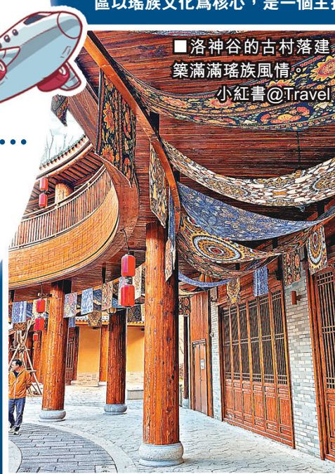
洛神谷的古村落建築滿滿瑤族風情。

時至今日，連州以喀斯特地貌自然景觀面貌吸引不少人前來旅遊，多個景點也可以沉浸式體驗連州的自然美景。若果想感受鄉村田園風情，融合瑤族文化與自然生態的洛神谷絕對不能錯過。位於連州瑤安瑤族鄉的瑤安洛神谷，屬於粵東、粵西、大湘西、贛鄱四大生態文化旅遊圈的中心點。景區以瑤族文化為核心，是一個主打生態、瑤族風情、溫泉及山水美景的旅遊勝地，森林覆蓋率超過92%，是廣東省森林城鎮和國家生態文明建設示範區的代表項目。這個古色古香的國家3A級旅遊景區，有群山環繞，據說正是這片高山阻擋着北方的冷空氣進入嶺南，難怪即使在冬天，這裏依然溫暖如春。大家到訪洛神谷，感受到瑤族特色體驗，景區亦融入了濃厚的瑤族文化，遊覽洛川河之餘亦可見洛陽風雨橋，深入體驗當地民族風情，亦可在茂林環抱中體驗露天溫泉。