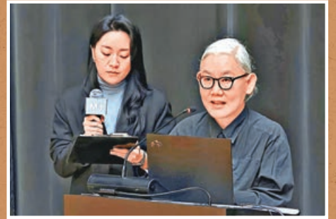
■李咄(右)以深具衝擊力與開創風格的作品廣為人識。

M+當代視覺文化博物館正於西展廳呈獻展覽「李咄：一九九八年至今的創作」，全面回顧韓國當代藝術家李咄多年來的開創性藝術成果。展覽呈現逾200件作品，包含大型裝置、雕塑、塑膠彩、紙上作品等，匯集來自李咄工作室及亞洲各地機構與私人收藏的作品。展覽更包括49件額外添置的作品，涵蓋李咄於1990年代末至2000年代初的早期創意實踐，以及她於2024年創作的作品。展期直至8月9日。 文、攝：雨竹