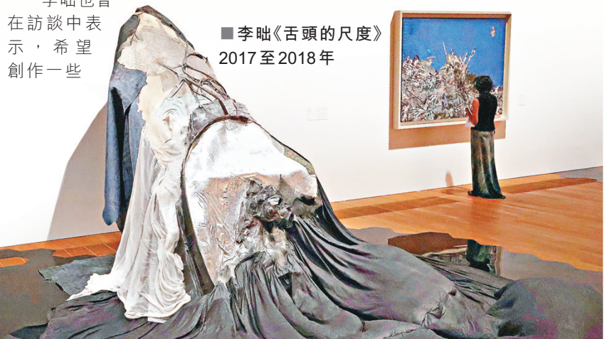
■李咄《舌頭的尺度》2017至2018年