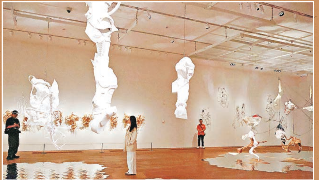
■展覽全面回顧李咄多年來的開創性藝術成果。