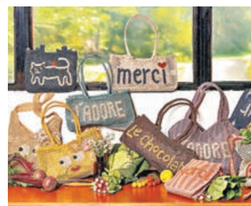
■ The Jacksons 的編織手袋有 8 種不同袋形。