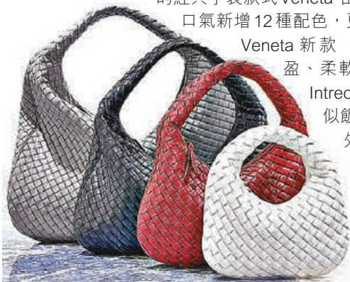
■ Baby Veneta 新款尺寸迷你可愛。

來自意大利的奢華品牌 Bottega Veneta，以標誌性的頂級皮革編織工藝出名，品牌採用高品質羊皮或小牛皮，兼具觸感與耐用性。Bottega Veneta 的經典手袋款式 Veneta 在今季系列迎來重大更新，一口氣新增 12 種配色，更推出尺寸迷你可愛的 Baby Veneta 新款（售價 $23,900）。主打輕盈、柔軟的填充皮革與經典無縫 Intrecciato 編織工藝，尺寸類似飯盒包型而且精緻小巧，外形簡約立體。韓星宋慧喬最近旅行巴黎期間，在 Ig 晒出的私服穿搭也預住這款 Baby Veneta，以亮紅色小包點綴休閒穿搭，不僅顯出好氣色而且造型減齡。