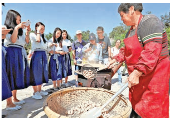
■ 土饅取用王屋山獨有土質烘炒製成。

濟源扎根太行南麓，獨特的地理風土孕育出質樸醇厚的本土滋味。每一道小吃都凝結着一方水土的生活智慧，成為漫遊途中不可錯過的煙火溫情。雞蛋不翻，是濟源深入人心的晨間風物。古法發酵的米漿注入特製鏊器，文火慢烙，全程無需翻面，煙火烘出金黃外皮，內裏綿軟溫潤，穀物清香純粹悠長。佐以本地秘製辣醬，鮮而不燥，再搭配一碗熱豆漿，簡單一餐便盛滿小城的煙火日常。