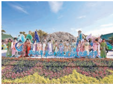
■ 身着漢服的工作人員。