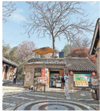
■ 位於王屋老街的屋頂咖啡館。

第二十屆王屋山文化旅游節在河南濟源王屋山下盛大啟幕，持續至5月底。群山疊翠，古觀凝香，一曲《和李白上陽台》的婉轉旋律在山谷間緩緩流淌。循着詩意樂聲，記者走進愚公故里濟源，踏訪天下第一洞天王屋山。遠離都市的緊繃節奏與日常內卷，在松濤雲海之間，於古觀草木之側，以一場漫遊邂逅山水清寧，安放俗世匆忙，讀懂藏在濟源群山深處的悠然與壯闊。 文、攝：劉蕊