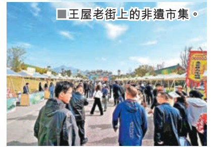
■ 王屋老街上的非遺市集。

當日，記者有幸隨同中國文物學會專家委員會主任、故宮博物院第六任院長單霽翔一行漫步古街，沉浸式感受老街的煙火與文脈。行走間，單霽翔在非遺攤位前頻頻駐足，仔細觀摩匠人技藝，認真聆聽文化傳承故事。來到特色小吃區，他不僅親口品嚐了雞蛋不翻、炒土饅等濟源地道風味，還興致勃勃地拿起工具，在攤主指導下嘗試製作雞蛋不翻。指尖起落間，他感受着這份民間美食的煙火溫度。