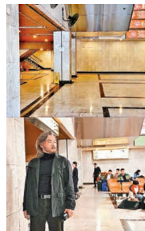
■《寒戰1994》團隊神還原舊機場大堂掀熱議。