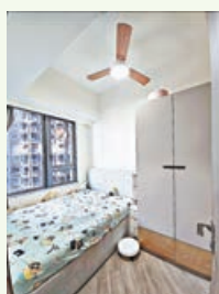
一房戶睡房可算十分寬敞。

另據了解，租客方面，不少是來自居於屯門區的分支家庭租客，希望遷入屯門市中心近年難得一建的大型新建屋苑社群。此外，因屋苑鄰近嶺南大學，且會所設施完善，每年都吸引一批來港入讀大學的內地學生承租。