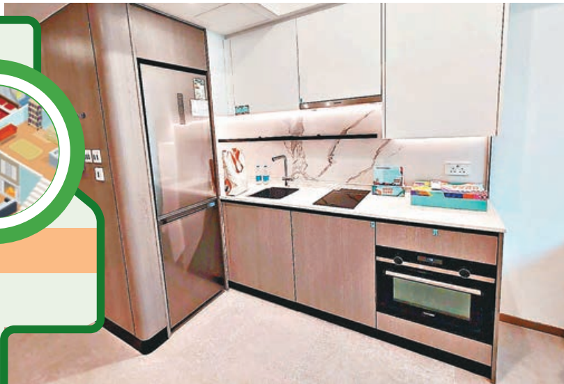
大門口收納櫃內藏直身大雪櫃。