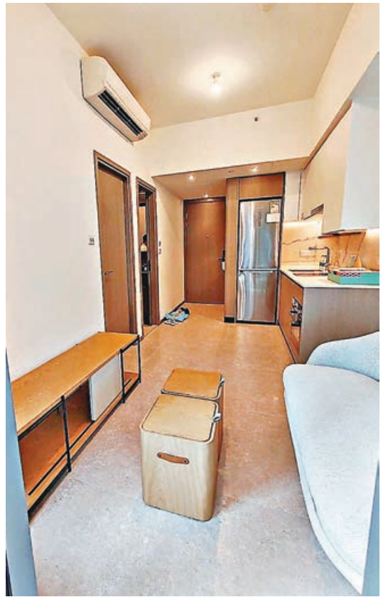
長方形大廳，焦點放在客廳。

至於NOVO LAND的買家，則以年輕首置客、小家庭及長線投資者為主要對象。此外，亦有投資者看好北部都會區發展項目而購入，加上屋苑提供開放式至兩房單位，吸引資金有限但想住新樓的買家。