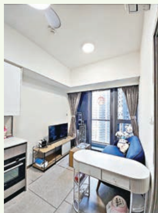
客廳連接露台，陽光充足。