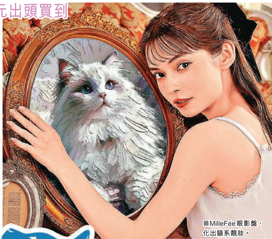
■ MilleFée 眼影盤， 化出貓系靚妝。

一向鍾意推出高顏值化妝品的小眾美妆品牌 MilleFée，推出貓咪造型眼影盤來俘虜一眾貓奴心。眼影盤的顏色靈感來自不同品種貓咪的個性與毛髮顏色，輕輕一抹，眼神自帶貓系無辜感。有霧面、珠光、閃粉等多種質地，顏色風格日常淡雅，無論上班或約會都能輕鬆駕馭。粉質細膩柔軟，觸感順滑不卡粉，像是布偶貓的柔和粉紅色、三毛貓的個性橘棕色、美國短毛貓的霧面淺藍珠光色，7款色調任你選擇。而且百元出頭就買到，性價比超高。現時，本港 cosme store 或者 LOG-ON 門市都能買到 MilleFée 的產品，有興趣的不妨逛逛。