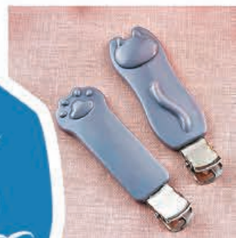
■ 貓咪髮夾造型 可愛實用。