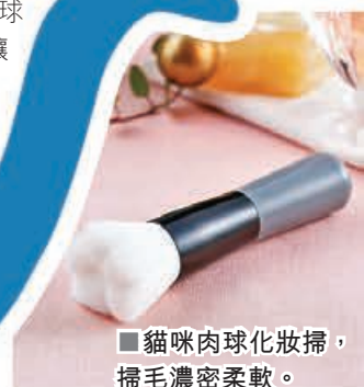
■ 貓咪肉球化妝掃， 掃毛濃密柔軟。

強。在上妝時，化妝掃的凹凸部分也能塗抹得非常順手。在擦粉底或是擦胭脂時使用，沾上粉底之後可愛的肉球圖案會更加明顯，讓整體化妝掃可愛加倍！