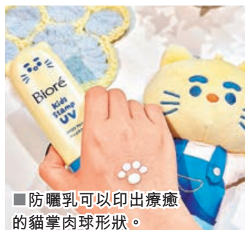
■ 防曬乳可以印出療癒的貓掌肉球形狀。

防曬產品是夏日必備的出門好物，最近 Biore 的一款防曬新品剛上市就爆紅，網民們直呼「連搽防曬都變得好玩」！原來這款新品是「貓咪肉球兒童防曬」，只要輕輕按壓瓶身，防曬乳就會印出療癒的貓掌肉球形狀，看起來就像被貓咪的爪子踩過一樣可愛。這款防曬乳讓很多原本不愛搽防曬的小朋友，都因為這個可愛設計而乖乖配合，甚至爭住自己搽防曬。除了顏值可愛，這款產品的防曬效果也相當高質，採用 Biore 獨家「水感持妝外膜」技術，在塗抹時能形成一層輕盈如「第二層肌膚」的鎖水膜，讓肌膚始終保持水潤清爽。擁有 SPF50 / PA++++ 的高防曬系數，無論是小朋友嬌嫩的皮膚還是大人易過敏膚質都啱用。