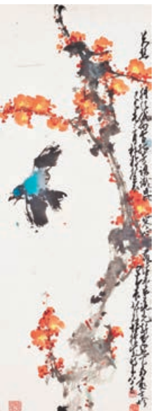
■《十里梅香》畫作盡展梅花的清雅絕俗和孤傲不凡。