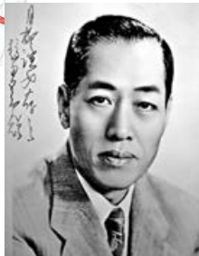
■左圖為場內展示趙少昂(黑白圖示)繪畫的示範影片。

香港文化博物館即日起舉辦「花韻詩情：趙少昂花卉與自寫詩選」展覽，以「寄情託物」為脈絡，精選館藏三十多幅嶺南畫派大師趙少昂教授的花卉題材精品，更罕有展出大師的自寫詩作，呈現詩與畫的完美契合。