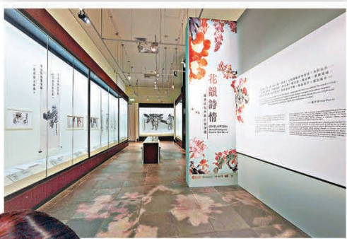
■香港文化博物館舉辦「花韻詩情：趙少昂花卉與自寫詩選」展覽。