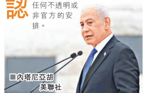
■內塔尼亞胡

阿聯酋方面則否認了有關內塔尼亞胡訪問阿聯酋，或阿方接待任何以軍事代表團的報道。阿聯酋外交部13日發表聲明稱，該國與以色列的關係公開透明，建立在眾所周知、正式宣布的「亞伯拉罕協議」框架內，絕非基於任何不透明或非官方的安排。