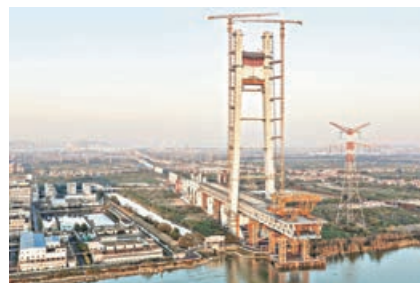
■深湛高鐵路網深江段建設現場。

在延伸粵北方向，作為構建國家「八縱八橫」高鐵路網京廣第二通道的關鍵段，廣州至清遠至永州高鐵路網預計今年第二季度完成可研批覆，爭取10月左右動工。該項目將填補湘南、粵北地區的高鐵路網空白，還規劃連接廣珠（澳）高鐵路網、廣深第二高鐵路網等線路，未來將連通