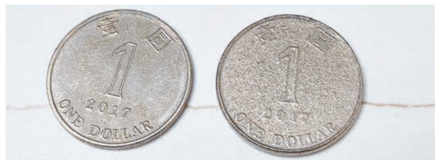
■右邊的1蚊硬幣正底兩面均呈磨砂面。

也有網友提到「2017年時都收到過，原來依家仲存在市面上！」「記得細個嗰陣有次買嘢，都收過咁嘅10蚊，輕好多」；更有網民上載疑似兩元假幣照，分享中伏經歷。而樓主也留言回應指，「新聞有話呢個係假嘅！！原來10年前已經有」，其後更附上新聞截圖，提醒大家日後找鏹時多加留意。