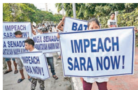
菲律賓抗議者在參議院外舉牌，呼籲彈劾副總統莎拉。

拉。彈劾理由書指控她濫用機密資金、賄賂政府官員、對總統小馬科斯發出刺殺威脅，以及擁有來源不明的財富。若彈劾法庭判決成立，莎拉將被免除副總統職務，並終身不得擔任公職。