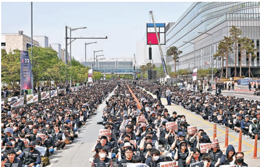
三星員工上月在平澤工廠外集會，高喊口號，抗議公司薪資水平。

韓國電子業巨擘三星電子的工會，定於5月21日啟動為期18天的總罷工。韓國當地法院18日批准三星電子的部分禁制令申請，要求工會的罷工行動不得影響生產，且罷工不得導致生產過程中的原料品質受損，若違反禁制令，工會將被每日罰款1億韓圓（約52萬港元）。然而三星工會強調，裁決結果不影響原定罷工計劃。