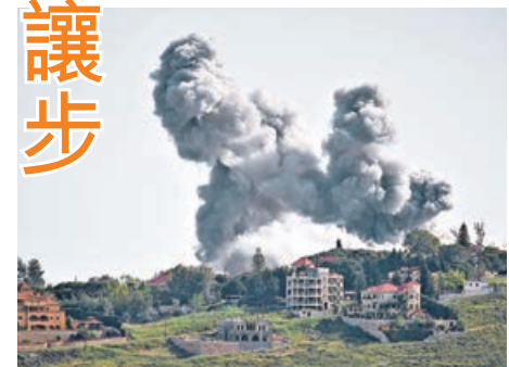
以色列並未應伊朗所求，停止轟炸黎巴嫩。圖為黎巴嫩建築物被炸。

特朗普17日還與以色列總理內塔尼亞胡就伊朗局勢通電話，主要討論重啟對伊朗軍事打擊的可能性。