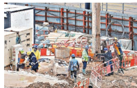
■任何人在建築地盤吸煙即屬違法。

《修訂令》適用於所有類型建築地盤，包括大廈維修工程地盤，住客正佔用的住宅及私人宿舍作居住用途的範圍則不包括在內。同時，《2026年建築地盤（安全）（修訂）規例》要求承建商及分判商須採取所有合理步驟，確保在建築地盤內無人吸用或攜帶燃着的指明吸煙產品，或使用無遮蓋燈火點燃指明吸煙產品，觸犯規定最高可處罰款40萬元。