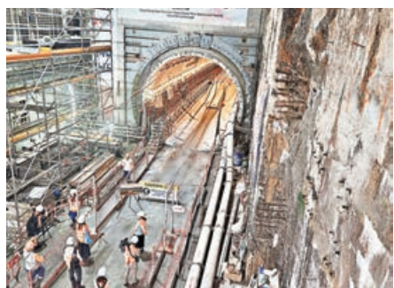
■港鐵正鑽挖往東涌西站的隧道。

港鐵正積極推進6個新鐵路項目，包括東涌線延線，目標於2029年完成工程。港鐵昨日表示，東涌線延線東涌西段的各項工程進度良好，其中東涌西站已完成頂層樓板和大堂層挖掘及樓板建造，正進行月台層挖掘及樓板建造，地面出入口及通風樓結構工程已展開，車站主體結構預計2027年上半年大致完成，隨後將開