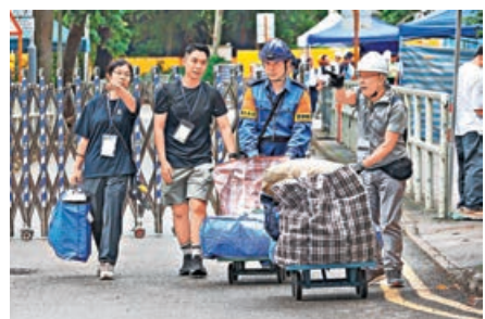
■政府跨部門專隊連日協助居民執拾。

大埔宏福苑7座受火警波及大廈明天（21日）起開放讓居民第二輪上樓，行政長官李家超昨日出席行會會議前表示，政府早前對宏福苑居民提出收購方案，以每平方呎8,000元至10,500元收購單位，並提供多種選項方便選購新單位，讓每個家庭按自身需要作出選擇。政府已經向各單位業主發出信件，希望他們細心閱讀有