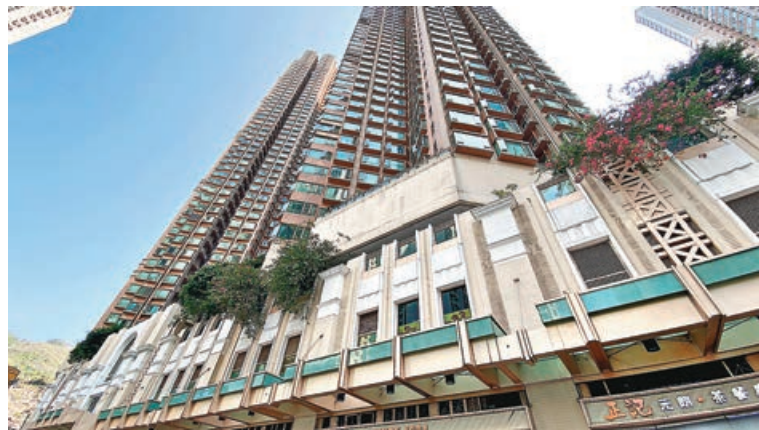
■新寶城兩房戶獲上車客以620萬承接，業主賬賺237萬。資料圖片

軍澳坑口站安寧花園5座中層B室交易，單位實用面積538平方呎，三房間隔，原以580萬元放售，最新以578萬元沽出，實用呎價10,743元。新買家為同區客，鍾情屋苑在港鐵站對面，並且附設商場，交通購物均十分便利，決定加快上車步伐。原業主持貨19年，當時單位亦已補地價，是次沽貨賬面可獲利437萬元。