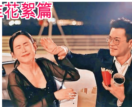
古仔上載MV幕後花絮。 小紅書

仔一手將頸巾掏落宣萱塊面，令她頭髮全亂了；還有原本互餵薯條，場面溫馨，但古仔卻整蠱宣萱，在狂質她食薯條下，搞到她面容扭曲，證明兩人感情深厚。古仔不捨留言：「將軍準備退下，多謝大家支持。」而宣萱亦留言：「咁快就最後階段，真係超級唔捨得。」網民就敲碗兩人再結緣拍攝電影版當續集。