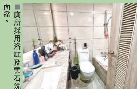
■廁所採用浴缸及雲石洗面盆。

中原地產網上資料顯示，海日灣現時約有40個放盤，實用呎價11,671元至24,720元。而屋苑的兩房細單位亦吸引上車客。是次放盤單位為實用面積515平方呎的兩房戶，業主叫價650萬元，實用呎價12,621元。