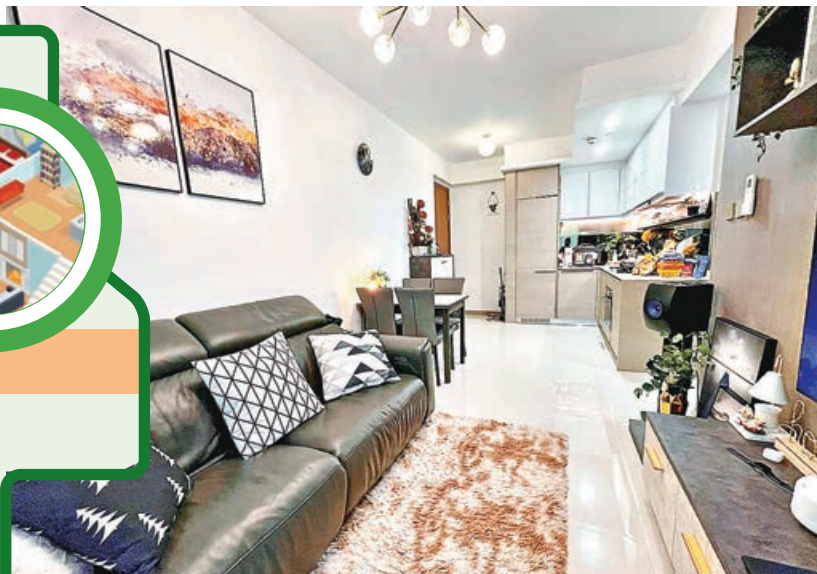
■長方形大廳空間感覺寬敞。