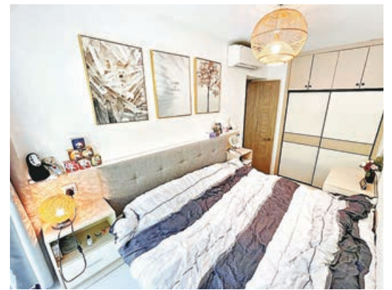
■睡房牆身掛上畫像，點綴一番。