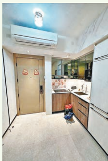
■開放式廚房臨近大門口。

近期租賃市場持續向好，雲滙較早前錄得1期2座中層B3室租務成交，單位實用面積357平方呎，開放式間隔，月租叫價15,000元，議價後以14,380元月租叫價租出，實用呎租約40.3元。而是次放租單位為1期低層，實用面積357平方呎，月租16,000元。據了解，雲滙因鄰近科學園及中文大學，租客以內地專才或留學生、科學園員工、醫護人員為主。另外，該屋苑提供大量細單位，因而大受單身人士及年輕小家庭歡迎。