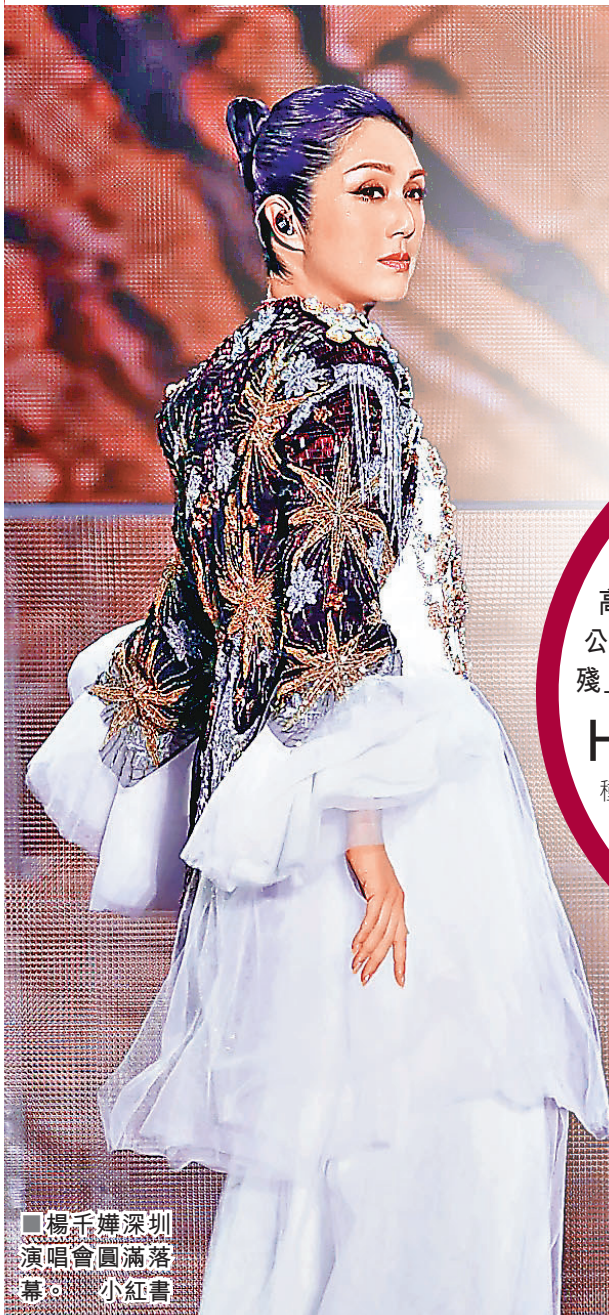
■楊千嬅深圳演唱會圓滿落幕。小紅書