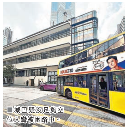
城巴疑沒足夠空位入彎被困路中。

中環一帶日間泊車位長期供不應求，部分司機卻貪方便胡亂泊車阻路，不時惹起公憤。近日就有網民發帖直擊有電動車在德輔道中一個路口的雙黃線禁區違例泊車，阻礙城巴沒空位入彎駛過，連累尾隨車龍寸步難行。大批網民留言轟司機癱瘓交通，有人慨嘆有錢交罰款「又真係大晒喎」；更有網民踢爆司機折返後竟嘆慢板未馬上將車駛走，「真係好自私」。