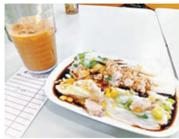
■腸粉加凍飲只收20元。

飲食業競爭激烈，不少食肆為求生存，各出奇謀推出五花八門優惠吸客。近日有位於青衣的茶餐廳更出動「時光倒流價」搶客，每日特價早餐僅收15元，另跟凍或熱飲亦只收5元，價格之低令網民嘩然，「15蚊？90年代呀？」「真心癲」。