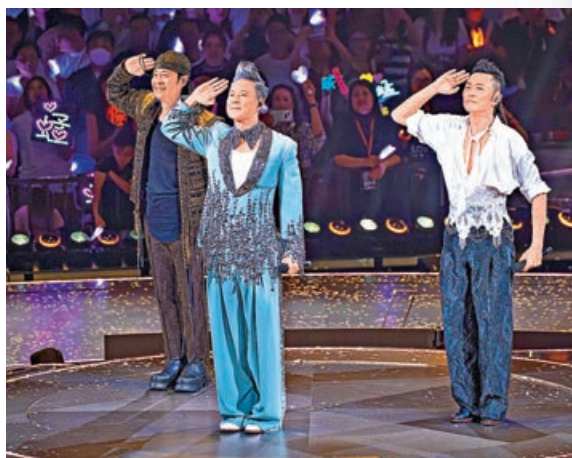
■草蜢剛完成紅磡演唱會。

操練及進食，最終成功回復到能夠穿着背心上陣的狀態，完美兌現了重返舞台的承諾。目前他仍一路接受治療中，並以平常心及堅強意志克服難關。