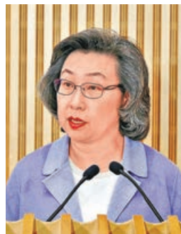
楊何蓓茵公布公務員薪酬趨勢調查結果。

立法會勞工界議員林偉江亦認為評核制度整體方向正確，不過，部分規模較小的政府部門，可能只有數十人甚至不足十人，若按指定比例要求，強制劃出一定人員比例不獲發增薪點，但部分前線公務員的工作表現較難量化，如負責牌照申領、文件處理的人員，若團隊成員都準時完成工作、出勤良好，表現相若，則很難在當中評出表現較差的人員。