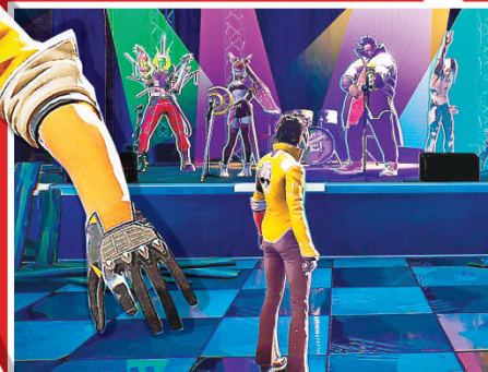
■挑戰四位曲風不同的前隊友。