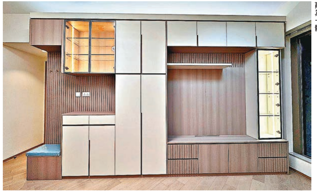
■客廳主牆將玄關穿鞋櫃、鞋櫃、展示高櫃及電視牆完美融為一體。