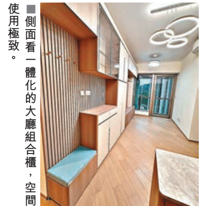
■側面看一體化的大廳組合櫃，空間使用極致。