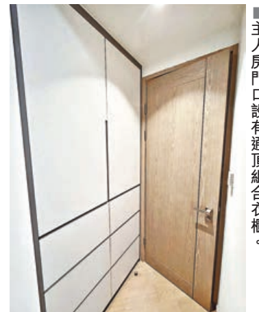
■主人房門口設有通頂組合衣櫃。