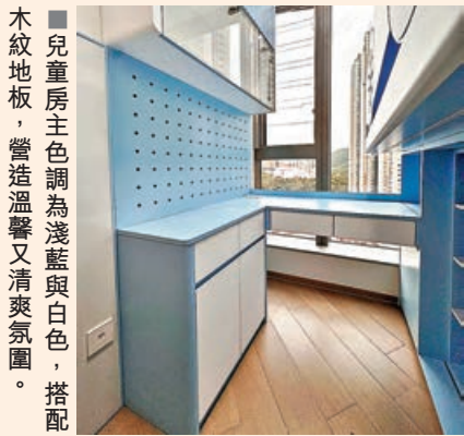
■兒童房主色調為淺藍與白色，搭配木紋地板，營造溫馨又清爽氛圍。