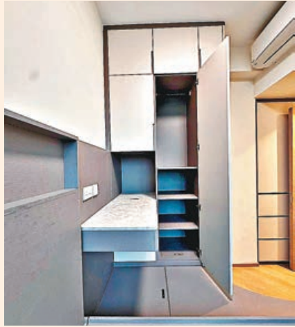
■主人房收納空間充足。