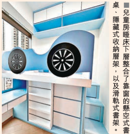
■兒童房睡床下層整合了靠窗的懸空式書桌、隱藏式收納層架，以及滑軌式書架。