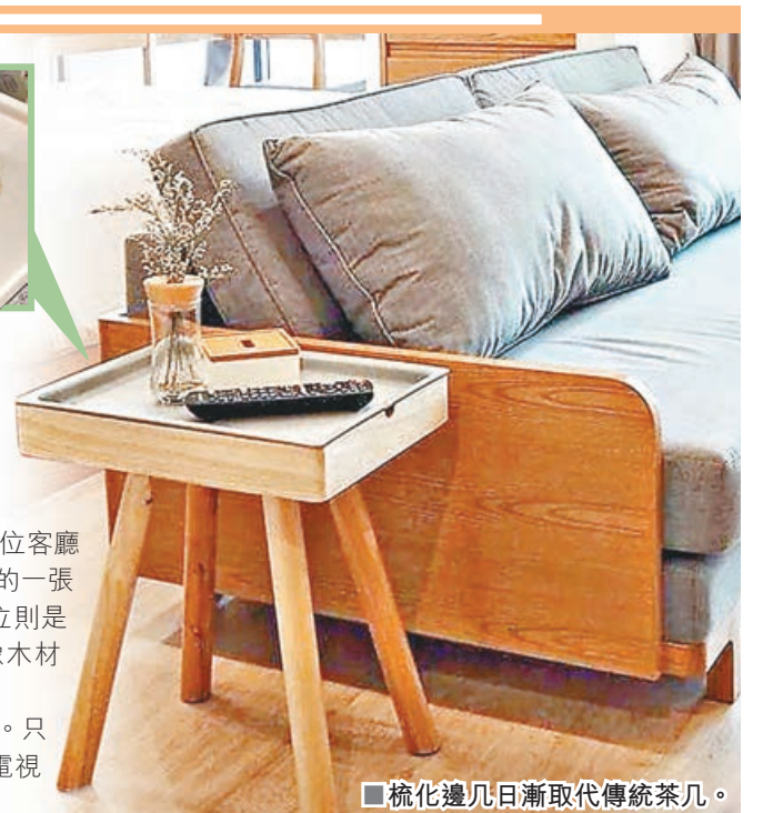
■梳化邊几日漸取代傳統茶几。

另外，這款梳化邊几不僅表面一層可以擺放茶點、書本外。只要揭開表面托盤一層，往下一層則可擺放其他生活用品，如電視遙控等。