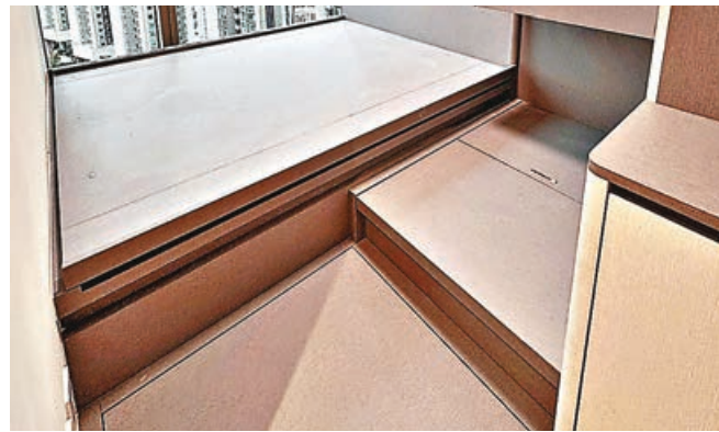
■主人房地台床增收納空間。