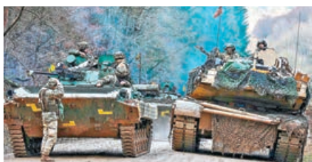
■美國數周內將向北約提交削軍計劃。圖為美軍在德國進行軍演。

五角大樓將在未來數周內向布魯塞爾的北約總部提交具體計劃，以明確美方計劃削減哪些軍事能力。一名美國國防部高級官員說，「在下一屆北約部隊徵集會議