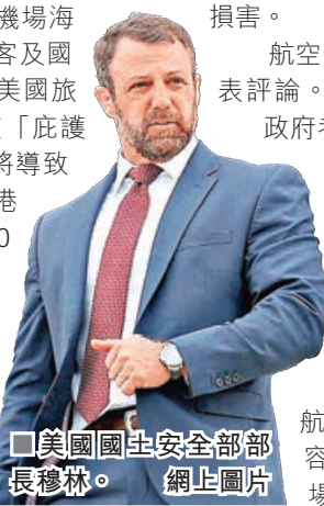
■美國國土安全部部長穆林。

航空公司方面尚未對該計劃發表評論。若該法案獲通過，即使政府考量後決定將生效時間延至世界盃後，也將對美國境內的貿易和旅遊產生重大影響。連鎖反應可能覆蓋全國所有機場，因航空公司的航線均為提前設定，僅將原定目的地屬庇護轄區的航班改飛往非庇護區並不容易，原因是許多繁忙機場缺乏額外營運容量。