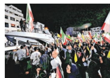
■在德黑蘭舉行的反美示威現場，展出一艘突擊快艇。

美國與伊朗就停火協議談判陷入拉鋸之際，美國總統特朗普已要求談判團隊就諒解備忘錄草案提出多項修改，特朗普 5 月 28 日在白宮戰情室與助手舉行長達兩小時會議，討論結束對伊朗戰事，並在會後要求修改草案中關於伊朗核計劃的條款。現有草案雖包含伊朗不尋求核武的承諾，但特朗普希望就伊朗濃縮鈾庫存的處理方式與具體時間表制定更嚴格規定。特朗普同時要求修改有關重開霍爾木茲海峽的措辭。