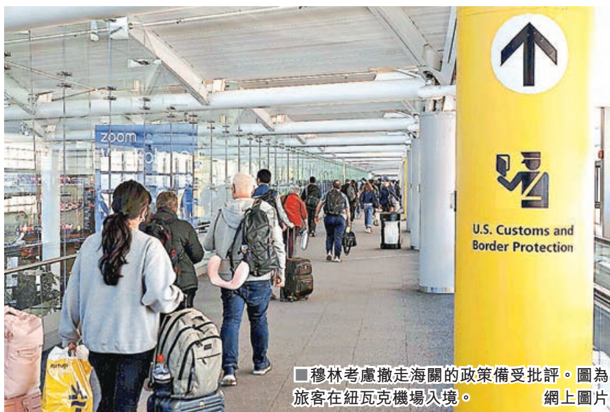
■穆林考慮撤走海關的政策備受批評。圖為旅客在紐瓦克機場入境。

一名知情官員透露，穆林自 3 月就任 DHS 部長以來，一直希望懲罰對抗聯邦移民執法的「庇護城市」。穆林 5 月 28 日表示，由於新澤西州執法部門未協助聯邦移民官員，美國當局可能很快停止在紐瓦克機場的國際旅客與貨物的通關查驗工作，還稱他也可能停止審查其他十多座「庇護城市」機場的入境申請，包括波士頓、丹佛、費城、芝加哥、洛杉磯、西雅圖及三藩市。他受訪時表示，「如果激進左翼民主黨人不允許聯邦當局在其社區執行移民法律，那我們也不該處理進入他們城市航班的入境申請。他們阻止移民執法，卻想讓我們在他們的設施內處理入境