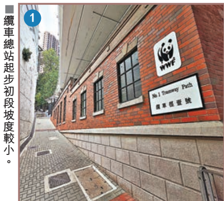
■ 纜車總站起步初段坡度較小。