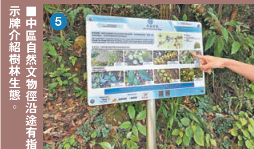
■ 中區自然文物徑沿途有指示牌介紹樹木生態。