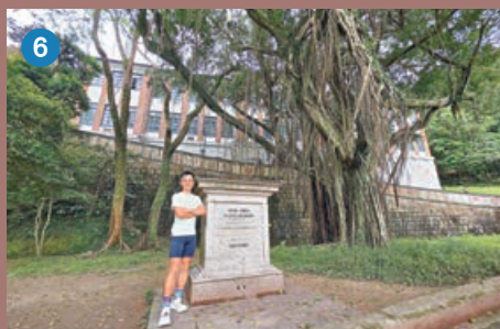
■ 舊域多利醫院產科大樓是極具價值的歷史建築物。