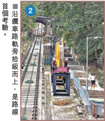
■ 沿纜車路軌旁拾級而上，是路線首個考驗。