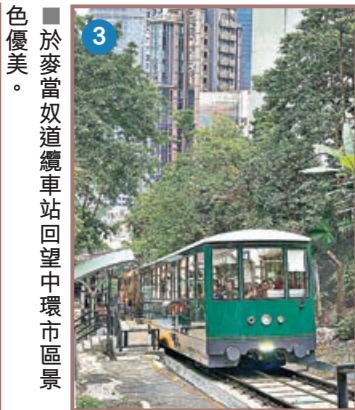
■ 於麥當奴道纜車站回望中環市區景色優美。