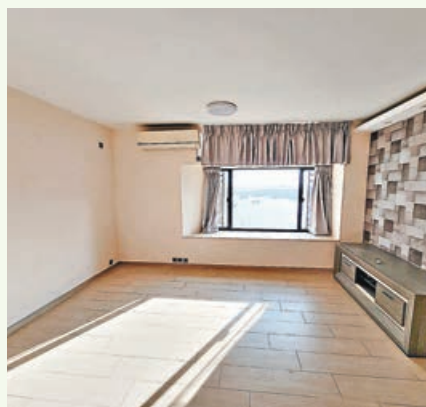
■巨型大廳相當闊落。