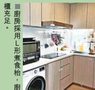
■廚房採用 L 形煮食枱，廚櫃充足。