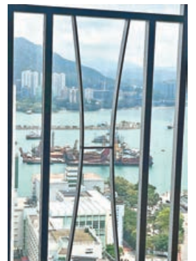
■單位望屯門碼頭海景。