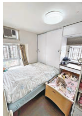
■主人房放得落大床及小床。