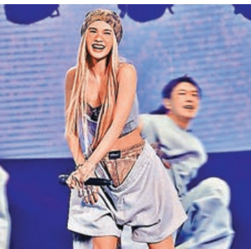
楊丞琳新造型被狠批。小紅書

有「可愛教主」之稱的楊丞琳（Rainie）近日在上海進行巡演，但新造型和舞姿卻飽受批評，網民更形容是「時裝災難」。有網民在社交平台上載Rainie身穿灰色露腰背心及短褲跳舞《Yes, but?》的短片，引來逾500多條留言，但一面倒負評，「以為她掛尿袋在扭」、「像穿了兩條大內褲，外面那件還鬆掉了」，又指其妝容似曬傷，言詞刻薄。網民又嘲她的舞姿難看，變了大媽跳廣場舞，甚至建議她不要開演唱會，好好演戲算了。