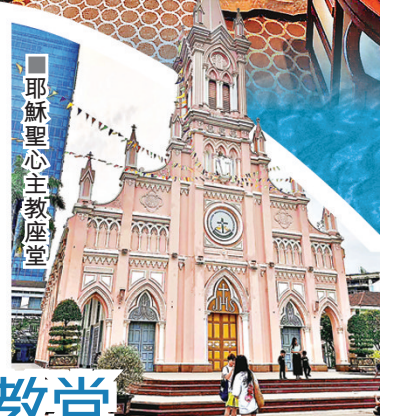
耶穌聖心主教座堂