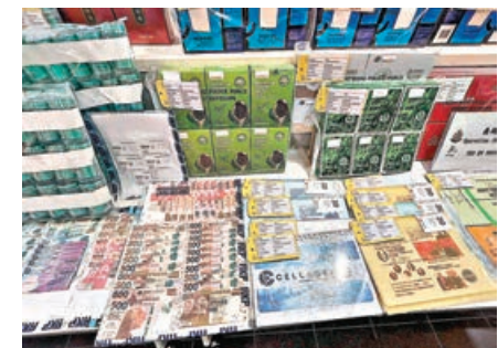
警方展示行動中檢獲的證物。

今年4月警方接獲長者報案，指早前透過親友介紹到觀塘一個聲稱有長者優惠計劃的工廈單位，登記成保健產品會員可享優惠及現金回贈。長者被誘騙交出身份證和住址證明，並被要求拍攝樣貌，透過手機進行虛擬銀行的人面識別即場開戶。事主其後與家人提起事件，擔心被騙個資作非法用途決定報案。警方發現當長者完