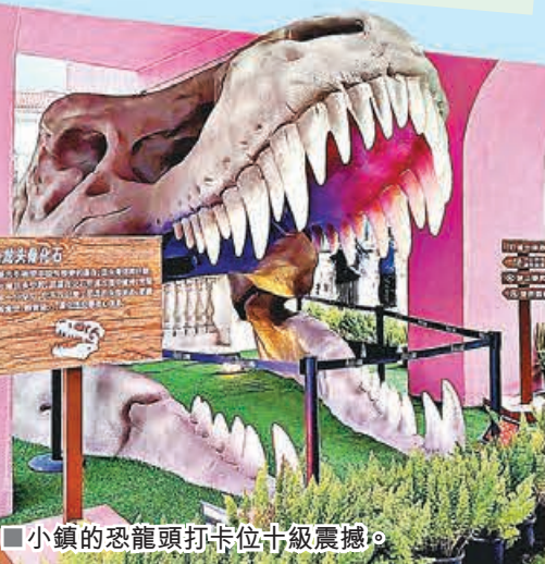
■小鎮的恐龍頭打卡位十級震撼。