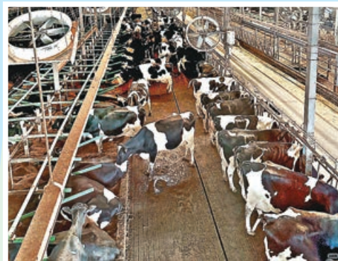
■大家可以親眼目睹牛奶生產過程。

大家若果攜同小朋友或情侶拍拖遊，可到訪坐落從化區鰲頭鎮、面積107萬平方米的大野牧鄉國際牧場，這個近年人氣親子與網紅打卡地，主打田園氛圍配合牧場體驗，飼養牛隻約3,000頭，是匯聚自然生態、玩樂設施、動物互動及住宿的親子園區。牧場分7大主題區域，人氣最強的「親近牧場」可供遊客近距離接觸20多種動物，包括乳牛、羊駝（草泥馬）、兔仔、香豬、梅花鹿等，大家可以在園區內購買飼料，體驗親手餵食。