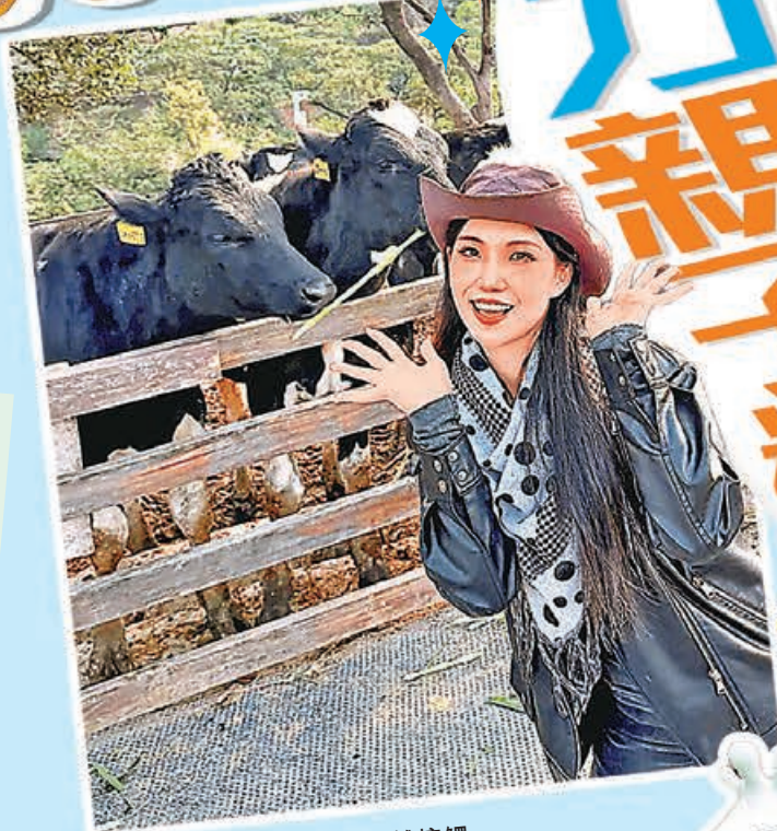
■大量乳牛等大家作近距離接觸。 小紅書@我是一個小太陽