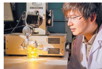
■ 團隊利用銅離子增加製氫效能。