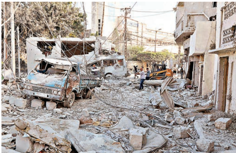
以色列襲擊黎巴嫩持續，黎南城市提爾的工人正在清理以軍空襲後留下的瓦礫。

美國與以色列就伊朗衝突的分歧日漸明顯。美國總統特朗普6月8日受訪時稱，他曾警告以色列總理內塔尼亞胡，如果以軍堅持繼續襲擊伊朗，以色列可能陷入孤立無援境地，暗示對以色列7日襲擊伊朗非常不滿。內塔尼亞胡同日表示，以軍已暫停襲擊伊朗，但若伊朗和黎巴嫩真主黨襲擊以色列，將會遭到以國武力回應。