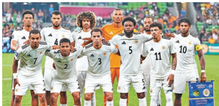
■ 中北美洲區庫拉索首次入圍。