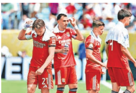
■ 國際足協因天氣炎熱，強制加入飲水時間。

另外，美國不少世界盃場館均是美式足球隊主場，以往多使用人造草，為符合FIFA賽事規範，多座世界盃場館近期陸續更換專屬草皮，採用聲稱為國際足球大賽打造的「混合天然草皮」技術，旨在提供最接近天然草地的場地品質，屆時草地情況如何，也是值得關注的課題。