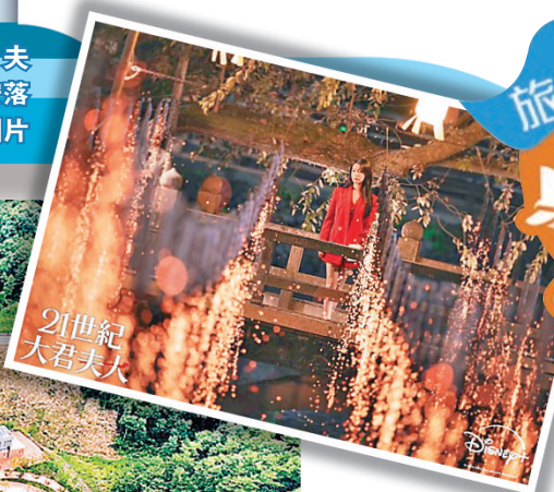
■岳陽生態公園內的大自然生態環境。