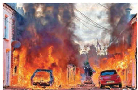
■在北愛貝爾法斯特東部倫德里克街，多輛汽車被示威者燒毀。

示威者當晚在多條街道聚集，先將一個燃燒的垃圾桶推向一輛巴士將其燒毀，隨後在東部倫德里克街等多處縱火。至少3間房屋、一間中東超市及多輛汽車在騷亂中遭縱火。有蒙面人踢門砸窗，並高喊「把外國人趕出去」，非白人住戶被迫撤