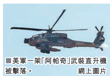
■美軍一架「阿帕奇」武裝直升機被擊落。

美伊短暫停火再次破裂，中東戰火重燃。美軍中央司令部於社媒發文，稱在總統特朗普指令下，美軍於美東時間9日下午5時開始對伊朗實施「自衛性打擊」，並稱此次行動是對伊朗「無端攻擊行徑的適度回應」，以回應美軍「阿帕奇」武裝直升機被擊落事件。聲明稱，美國空軍和海軍戰機精準打擊霍爾木茲海峽附近的伊朗防空系統、地面控制站和監控雷達，共打擊約20個目標，美軍後續還將有更多空襲。