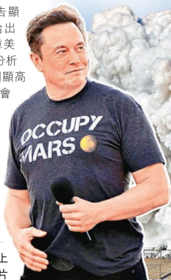
■馬斯克拍片為SpaceX上市造勢。

晨星發布的研究報告顯示，該公司對SpaceX給出的公允價值僅約7,800億美元（約6.1萬億港元）。分析師歐文指出，該公司被明顯高估，投資者在IPO後有機會以更具吸引力價格買入。他認為SpaceX旗下太空業務的商業衛星發射成本優勢是其護城河，但子公司xAI的人工智能（AI）業務不確定性極高，可能帶來實質性價值毀滅風險，因其AI助