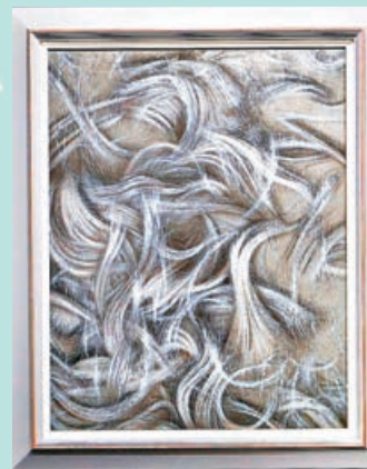
■《黑色線描》2025展現幻象之實。

對於以假髮做創作題材，江衡初時欲營造一種歷史與當今的呼應關係：「歷史中很多部分會在如今重演。」江衡指假髮在歷史上是個人社會地位的象徵，社會賦予其意義在中國與西方歷史中存在差異，包括從古埃及、古希臘、古羅馬直至當代皆然。人們在不同時期也對假髮有不同定義，最終也會指向人與物的關係。至於另一系列「我把身體分成像素碎片分給你」，創作始於2020年，江衡稱此系列與「假髮絲」系列的共通點之一是碎片化。他娓娓道來：「這些帶有各種色彩，形態抽象的作品，體現出我關注的，當前AI技術發展對人類產生的影響。這批作品皆為自然界花朵的延伸形態！」江衡構思出由AI解構，再重組花朵，把花朵轉為像素花。