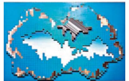
■《我把身體分成像素碎片分給你 No.4》2022形態抽象。