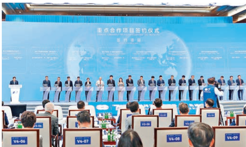
■第七屆跨國公司領導人青島峰會現場進行重點項目簽約。

第七屆跨國公司領導人青島峰會 16 日開幕。峰會共吸引了 357 家跨國公司參會，其中世界 500 強企業 105 家、行業領軍企業 252 家。《跨國公司在中國：創新協同築生態 產業融合向未來》研究報告）發布。報告指出，2025 年，中國實際使用外資 1,046.8 億美元，連續 16 年保持在千億美元以上；新設外資企業數量突破 7 萬家，同比增長 19.1%，反映跨國公司對中國市場的堅定信心和長期布局意願。報告也表示，「十五五」期間，中國將為跨國公司深度參與中國創新鏈產業鏈、共享發展紅利開闢新空間。