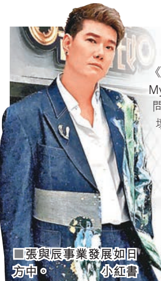
■張與辰事業發展如日方中。 小紅書