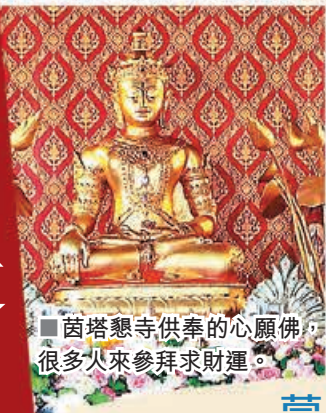
■茵塔懇寺供奉的心願佛，很多人來參拜求財運。

位於清邁舊城三王紀念碑南側的茵塔懇寺(Wat Inthakhin)，是一座底蘊深厚的歷史古廟。大殿內供奉著該寺最受尊崇的主尊龍婆考佛(Luang Pho Khao，白佛)，其純白的外觀寧靜祥和，備受當地居民與遊客敬仰。除了白佛，寺內還有一尊極具代表性的蘭納風格「心願佛」，祂頭戴冠冕、手戴手鐲，象徵著榮華富貴與招財，吸引了無數信徒前來祈願。