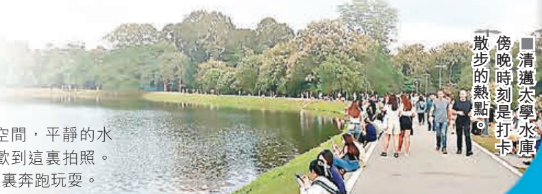
■清邁大學水庫傍晚時刻是散步的熱點。

拜過4尊「心願佛」後，大家可到清邁大學水庫，於傍晚時打卡散步。這個水庫建造目的是儲存清邁大學校內使用的水，面積相當廣闊。後來這裏變成公共空間，平靜的水面倒映著樹影美景，人們喜歡到這裏拍照。同時，當地人亦會帶寵物來這裏奔跑玩耍。