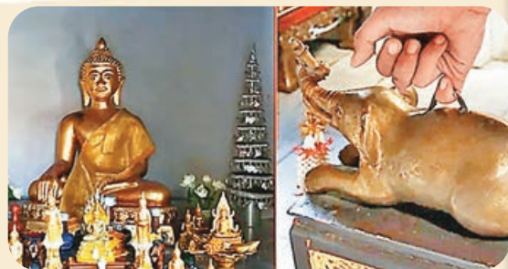
■帕辛寺許願時用右手小指勾著象背上的銅環，如果能將小象勾起來，願望將會實現！

在著名的帕辛寺(Wat Phra Singh)旁，隱藏於Thammarat Sueksa學校內，也悄悄供奉著另一尊十分靈驗的「心願佛」。這尊佛像安置在校園內的一座寧靜小殿中，平時少有觀光客驚擾，卻是清邁當地人的私房祈福聖地。相傳在這祈求姻緣與事業工作上特別靈驗，幾乎是有求必應。佛殿內最特別的，莫過有一塊用銅做成的象磚，據僧侶介紹，在許願時，用右手的尾指勾著象背上的銅環，如果能將小象勾起來，願望將會實現。