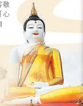
■蒙天寺戶外大佛佇立在清邁古城北側的護城河畔。

拉差蒙天寺(Wat Rajamontean，常被通稱為蒙天寺)坐落於清邁古城北側的護城河畔。該寺最醒目的地標，當屬戶外那尊高聳宏偉的心願佛。這座巨大的佛像高達十多米，在藍天映襯下顯得無比莊嚴，相傳這裏祈求心願成真、參拜許願極為靈驗。