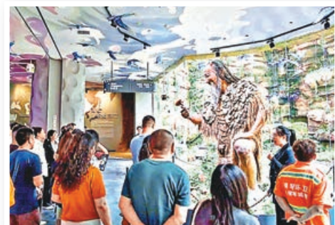
■中醫藥文化體驗館主打全像投影與VR互動。

值得一提，被譽為「南海第一泉」的珠海海泉灣度假區以純天然海洋溫泉為核心，與香港多家旅行社合作推出家庭度假套票，涵蓋海洋溫泉、神秘島樂園、加勒比水公園等項目，更有針