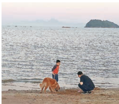
■珠海的沙灘適合家庭客遊玩。

另外，大家亦可前往「廣東省歷史文化名村」北山村，這是一座擁有780多年歷史的嶺南古村落，現存108棟歷史建築。這裏以「保存完好的廣府建築群、活化古建築與國際文藝融合」為特色，堪稱珠海市區最成規模、最具國際文藝氣質的歷史文化街區。大可看看老祠堂裏舉辦的現代藝術展，感受時光交錯的奇妙魔力。