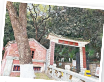
■唐家古鎮共樂園讓大家穿越到民國時期。