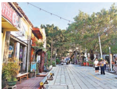
■北山村是擁有700多年歷史的嶺南古村落。