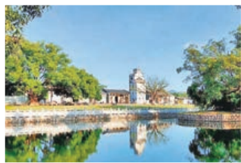
■會同古村保存完好的「三街八巷」。

古鎮也入選《中國古鎮》特種紀念郵票；會同古村則榮膺「廣東十大美麗鄉村」。而淇澳島則集紅色愛國主義、綠色生態、藍色海洋文化於一體，構成唐家灣豐富多彩的旅遊畫卷。街頭巷尾還能尋獲唐家灣茶果、會同泥煨雞等地道特色美食，讓味蕾感受一場懷舊之旅。