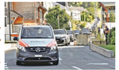
■美伊首輪會談完結後，各國代表乘車離開比爾根山。

伊朗和美國代表團 6 月 21 日在瑞士比爾根山舉行停火協議首輪談判。經過 18 小時談判後，雙方在巴基斯坦和卡塔爾斡旋下，於當地時間 22 日凌晨宣布達成協議，協議以斡旋方聯合聲明形式發布。伊朗傳媒證實，首輪談判達成的協議包含 5 項要點，伊美就在未來 60 天內達成最終協議的路線圖取得一致，雙方曾簡短討論伊朗核問題，但未就此進行談判。