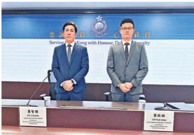
警方講解犯罪集團運作模式。

香港警方經追蹤分析，並透過騙案預警計劃，再發現118個相關傀儡銀行戶口，繼而識別出另外173名受害人，共被騙取近2億港元。警方並成功阻止900萬港元進一步損失。今年首季，警方共錄1,210宗投資騙案，與去年同期1,208宗相若，佔整體詐騙案一成左右。惟在損失金額方面，今年首季投資騙案損失總額達9.2億港元，比去年同期上升一成七，佔今年首季整體詐騙案總損失金額一半，情況不容忽視。