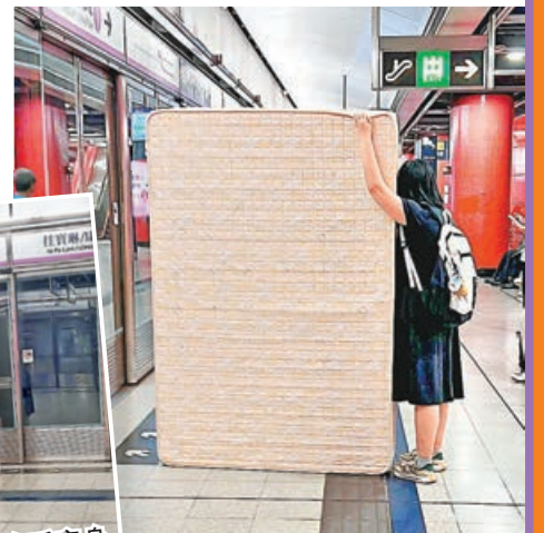
■床褥長度較女乘客身高還要高。網上截圖

一眾網民對相中人能獨自在港鐵範圍搬運床褥嘖嘖稱奇，「其實6呎乘4呎雙人床褥係好重，點解一個咁矮嘅女仔可以搬得到？」「力壯如牛，氣拔山河」、「啲職員去晒邊度？」「真的不能更癲！港鐵職員真的大發慈悲！」但亦有不少網民直指是AI相片，質疑如此猖獗難逃職員法眼。