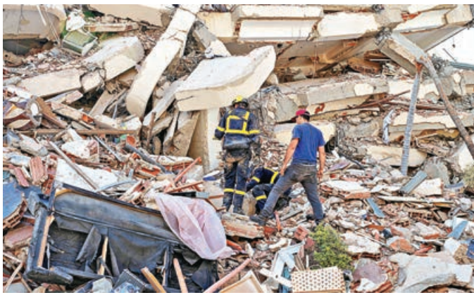
■法國救援人員在拉瓜伊拉州倒塌建築物中搜救生還者。路透社

據法新社和路透社報道，位於委國北部沿海城市拉瓜伊拉是受災最嚴重地區之一，當地至少100棟包括高層住宅在內的大樓因強震毀損或倒塌。地震發生後，當地居民和志願者因重型機器不足、官方救援力量有限，只能徒手在瓦礫堆中尋找生還者。社媒流傳的影片顯示，搜救人員於26日夜間在探照燈協助下，從倒塌的瓦礫堆中救出一名嬰兒，其被包裹在棉被中，由搜救人員小心翼翼地接力傳遞，現場響起陣陣掌聲。