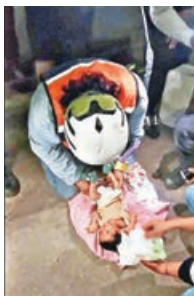
■救援人員為獲救的初生嬰兒作檢查。

委內瑞拉6月24日晚發生的連環地震，官方證實已增至1,430人罹難，而據中國駐委大使館消息，截至當地時間27日下午，已確認有8名中國公民遇難。在搜救爭分奪秒進行之際，接連傳出令人鼓舞的消息，一名僅18日大的嬰兒在受困32小時後奇跡獲救，另有一名11歲男孩遭廢墟掩埋3天後被救出，為救援工作帶來希望。