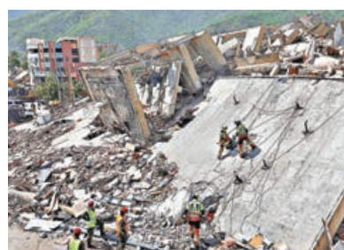
■ 墨西哥救援隊在委國倒塌建築物中搜救生還者。

美方南方司令部29日表示，約130名美國海軍陸戰隊員預計在24小時內抵達重災區拉瓜伊拉港，協助港口重啟，打通海路物資運輸通道。軍艦勞德代爾堡號已透過登陸艇將首批物資運送至拉瓜伊拉港。