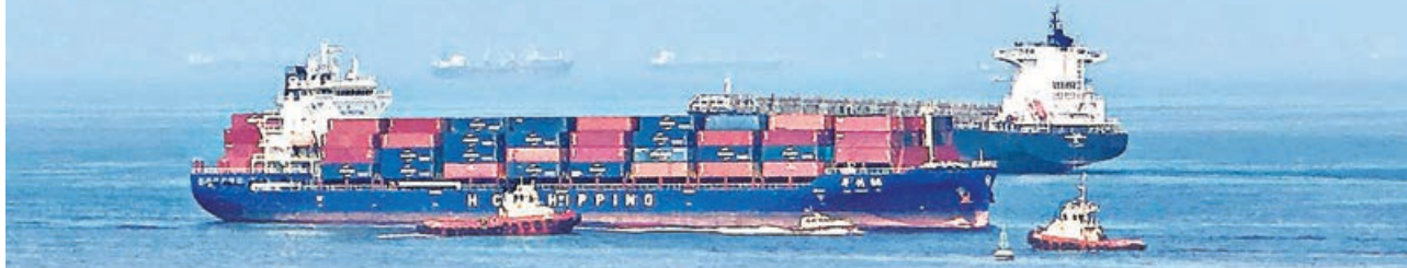
■ 霍峽問題再成美伊衝突重點。圖為一艘貨輪停泊在阿曼附近霍峽水域。

美國與伊朗近日再次交火，互相指責對方違反本月較早時達成的停戰諒解備忘錄。美方官員6月28日披露，美伊兩國已同意停止互相襲擊，由於局勢升級，原定30日在瑞士舉行的談判，改為在卡塔尔首都多哈進行，談判重點從伊朗核計劃轉為聚焦霍爾木茲海峽問題。伊朗外長阿拉格齊同日表示，伊朗會全權負責霍爾木茲海峽管理，獨攬控制權限。