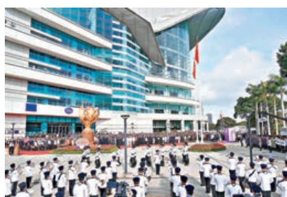
■特區政府昨於灣仔金紫荊廣場舉行升旗儀式。

第二，全速推進北部都會區建設，以大學城、產業、科技，以及宜居、宜業、宜遊為北都建設目標，成為香港發展突破點。北都區已從紙上藍圖進入收成期。河套港深創科園香港園區已於去