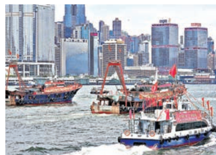
■多艘漁船維港巡遊賀回歸。

此外，電車由昨日一連三日供市民免費乘搭，民青局局長麥美娟昨日出席啟動禮指，免費活動由香港中國企業協會聯同5家駐港中資企業合辦，充分體現中資企業以港為家、服務社會的擔當與情懷，期望協會及在港中資企業未來繼續舉辦多