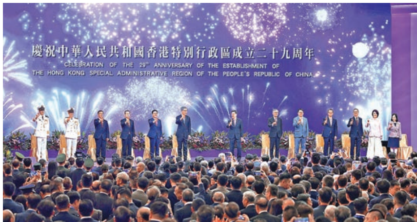
■特區政府昨日在會展舉行慶祝酒會。

李家超致辭時表示，4年來他改變了政府文化，建立「以結果為目標」的政府，解決香港累積多年的問題；建立了安全和穩定的香港，歷史性完成基本法第二十三條本地立法；完善了選舉制度、強化了地區治理，全面落實「愛國