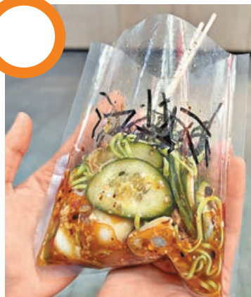
■撈冷麵是童年味道。