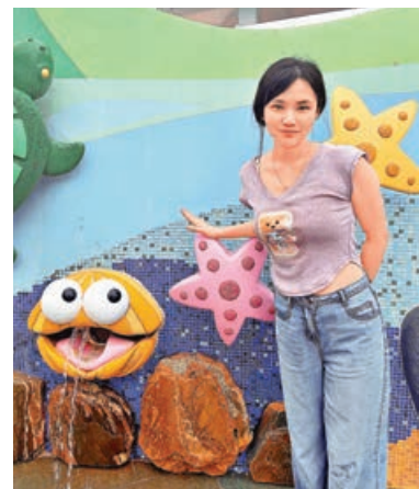
■「嬉水感官牆」繽紛多彩。