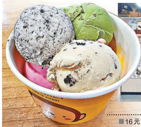
■16元可選5種口味的小球。

別口味如海鹽地球、頂級榴槤、王牌乳酪、芝士繽紛等需要另外加錢。16元就可以食到5種口味的一大碗雪糕，性價比冇得輸，色彩斑斕，承包你一整天的好心情。味道方面，慳妹就推薦地道綠茶，不會好甜，茶味也很濃郁，絲毫不輸要加錢的口味！