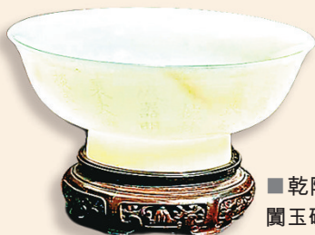
■乾隆款御題《詠和闐玉碗》撒口碗

而在翡翠專區則有重點展品「靈芝形翡翠如意」，展覽執行策展人高洋介紹，當時緬甸產的翡翠雖已進貢至清宮，但尚未完全納入中國傳統玉文化體系，工匠仍參照傳統和田玉的審美標準進行雕琢。造就了這件清代宮廷與東南亞物質貿易和文化融合的工藝。而翡翠展區的不同展品，也折射出不同皇朝統治者對翡翠材料的不同喜好。