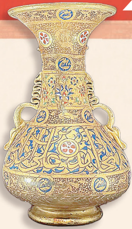
■《古蘭經》 撒口雙耳瓶