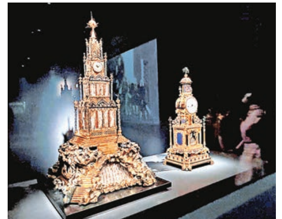
■音樂鐘（左）與水法問樂鐘。