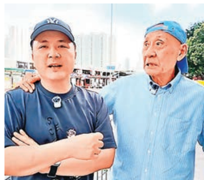
■鼎爺活力十足。 李泳豪網上頻道

從影片中可見，鼎爺當天頭戴一頂淺藍色Cap帽，並特意將帽子反轉佩戴，活力十足。兩父子在九龍城穿梭大小街道，鼎爺分享童年往事時思路清晰，沿途對區內的戲院、當舖等舊址如數家珍。