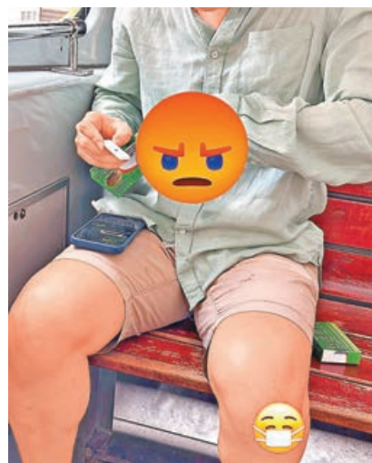
有電車乘客當眾做快測惹起公憤。 Fb截圖

網民一面倒批評相中人缺乏衛生意識，公德心欠奉：「好恐怖」、「唔係咁話？咁人嚟㗎」、「呢啲人正XX，真係有病D細菌就會散開去，其實都唔爭在嗰10幾分鐘，返屋企做測試都唔係好耐啫，正一自私精」。此外，該男乘客下巴外露，似未戴上口罩，有心水清的網民更留意到其下巴有滴液體，不知是「口水定鼻